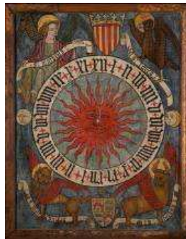
Indicador horario del reloj del monasterio de Santa María de Veruela (Zaragoza) Ca. 1475/76-1479 Pozuelo de Aragón (Zaragoza). Iglesia Parroquial de la Asunción de N ra Señora. Obispado de Tarazona

Da la bienvenida al visitante a este ámbito el llamado Reloj de Pozuelo de Aragón; una pintura al temple sobre tabla con el escudo del Señal Real de Aragón y del abad de Veruela, Gonzalo Fernández de Heredia y Bardají. Se trata del único indicador visual de un reloj bajomedieval localizado hasta el momento en la Península Ibérica para la etapa del final de la Edad Media.