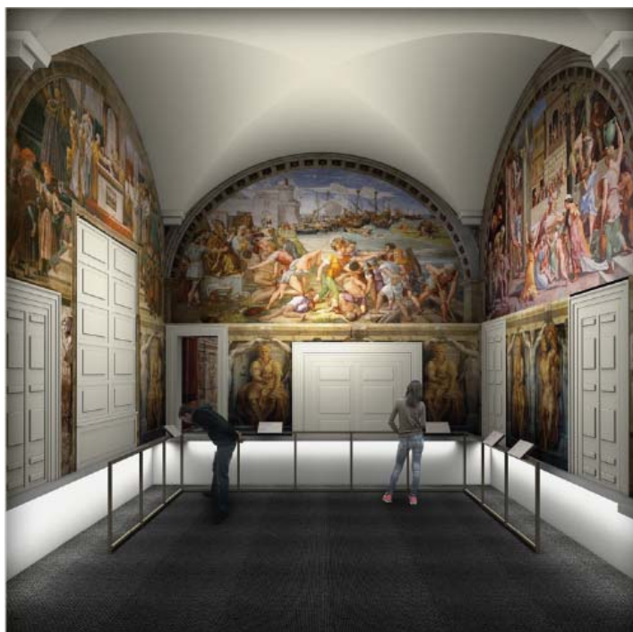
Recreación de la Estancia del Incendio del Borgo

En 1515 el Papa León X definió a Fernando el Católico como ' fortísimo atleta ' de Cristo y como uno de los cinco pilares de la cristiandad. Es por eso que hizo pintar su figura junto a las de Carlomagno, Lotario I, Astolfo y Godofredo de Bouillon en la llamada Estancia del Incendio del Borgo diseñada por Rafael. El punto final a la exposición es precisamente una recreación de esa sala vaticana que, en esta ocasión, se levanta junto al Torreón del Trovador de la Aljafería.