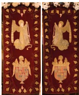
Reposteros de los Reyes Católicos Autor desconocido Ca. 1482-1488 Daroca (Zaragoza). Arzobispado de Zaragoza. Parroquia de Santa María de los Corporales

Se muestran también ricas piezas que pertenecieron al propio rey, como el Misal Breviario procedente de la Biblioteca Apostólica Vaticana, decorado con púrpura y oro sobre pergamino; o que fueron financiados por él y la reina Isabel. Es el caso de dos significativos Reposteros de los Reyes Católicos de la iglesia de Santa María de los Corporales de Daroca, que durante la exposición van a colgar de las paredes de la sala de Pedro IV y que fueron donados por los reyes, muy devotos de la reliquia de los Corporales.