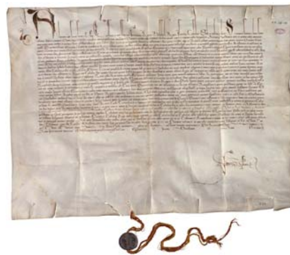
Bula de Alejandro VI, concediendo a don Fernando y a doña Isabel el título de Reyes Católicos Roma, 19 de diciembre de 1496

procedente de los Museos Vaticanos y dos importantes documentos: el del papa Julio II otorgando a Fernando el Católico la investidura del reino de Nápoles y la Bula de Alejandro VI concediendo a Fernando e Isabel el título de Reyes Católicos.