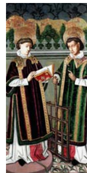
San Lorenzo y San Vicente c. 1479-1484 Colección Casacuberta Marsans