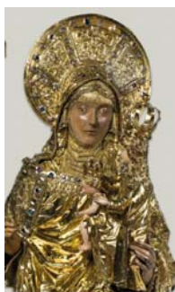
Busto de Santa Ana con la Virgen y el Niño Autor desconocido. Ca. 1480 con modificaciones barrocas Zaragoza, Cabildo Metropolitano. Basílica del Pilar

Además se muestran delicados objetos de orfebrería religiosa y civil que revelan la calidad de los talleres de platería que había en Zaragoza y Daroca. Así se exhibe un busto relicario renacentista que representa a Santa Isabel de Bretaña , que constituye una de las mejores piezas de orfebrería de la colección del Victoria&Albert Museum. Se puede contemplar también el busto gótico de Santa Ana con la Virgen y el Niño de la Basílica de El Pilar de Zaragoza; una rica pieza de plata sobredorada con gemas preciosas y una de las obras que el Gobierno de Aragón ha restaurado para esta exposición.