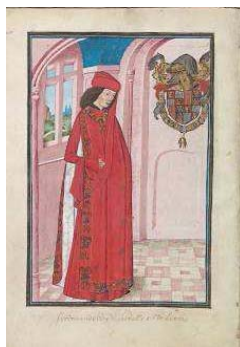
Estatutos, ordenanzas y armorial de la Orden del Toisón de Oro Países Bajos meridionales, 1473 (con adiciones posteriores) Retrato y armas de Fernando II de Aragón, fol. 74v La Haya, Koninklijke Bibliotheek

Previamente, ya desde su etapa como Rey de Sicilia, Juan II había fomentado en Europa la representación propagandística de Fernando de Aragón. Los Estatutos de la Orden del Toisón de Oro , que se pueden contemplar, recogen el retrato y las armas del monarca aragonés. Se trata de un códice en pergamino realizado cuando el entonces rey de Sicilia fue nombrado caballero del Toisón de Oro y que actualmente se conserva en el Koninklijke Bibliotheek de La Haya.