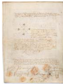
Testamento de Fernando el Católico Madrigalejo, 22.01.1516 Madrid, Fundación Casa de Alba. Editorial Testimonio

La figura de Fernando II de Aragón cobró especial relevancia durante los siglos XVI y XVII. Dan buena muestra de ello en la exposición dos publicaciones: Historia del Rey don Hernando el Catholico de Jerónimo Zurita y El Político de Baltasar Gracián. Junto a ellas, el último Testamento de Fernando II redactado en Madrigalejo el 22 de enero de 1516; un pergamino original actualmente propiedad de la Fundación Casa de Alba.