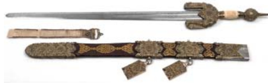
Espada nazari (Jineta) atribuida a Boabdil "el Chico" Taller granadino (empuñadura) Siglo XV Toledo, Museo del Ejército

Fernando II desplegó su acción y proyectó su influencia sobre grandes personalidades históricas, desde emperadores, hasta papas y cardenales, reyes, hombres de letras y de armas. Objetos, retratos y documentos de todos ellos sirven para ilustrar la dimensión política de su reinado y de sus relaciones con personajes como Colón, el conde de Tendilla, el Gran Capitán, Boabdil, el cardenal Mendoza, Maquiavelo o Maximiliano de Austria.