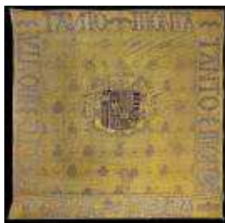
Repostero con el lema Tanto Monta Inscripciones "TAN/TO", a la izquierda y "MO/NTA", a la derecha. Posterior a 1492 Toledo, Cabildo Catedral Primada

Los Reyes Católicos impulsaron durante su reinado la utilización de señales heráldicas, motes y divisas como seña de identidad y forma de perpetuar su memoria. Buen ejemplo de ello es el propio Palacio de la Aljafería que alberga la exposición y en particular el Salón del Trono. En esta sala, junto a los retratos y documentos, se exponen varios objetos significativos del uso de estas enseñas. Uno de los principales: el repostero con el lema Tanto Monta de la Catedral de Toledo, con brocado de oro y el escudo de armas de los soberanos. Junto al repostero, una gran estatua de Fernando en madera policromada procedente de la Capilla Real de Granada, que nunca hasta ahora se había visto fuera de esa ubicación.