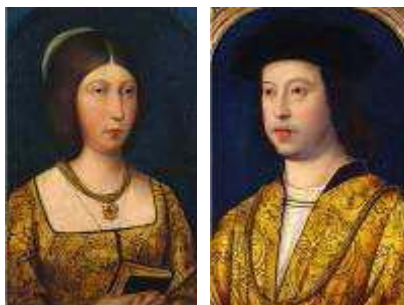
Retratos de Isabel de Castilla y Fernando II de Aragón Pintor desconocido inglés. Ca. 1500-1510

La exposición ofrece la posibilidad de contemplar, juntos por primera vez, cinco de los retratos individuales que se pintaron de Fernando el Católico. Se trata de cinco obras realizadas al óleo sobre tabla del Museo de Poitiers, del Kunsthistorisches Museum de Viena, del Staatlichen Museen-Gemäldegalerie de Berlín y de la Society of Antiquaries de Londres. Junto a ellos los retratos de Fernando II y de Isabel de Castilla procedentes de Windsor; dos obras de arte pertenecientes a la colección de la Reina Isabel II de Inglaterra que fueron pintados hacia 1500-1510 y que salen por primera vez del Reino Unido para exponerse en Zaragoza.