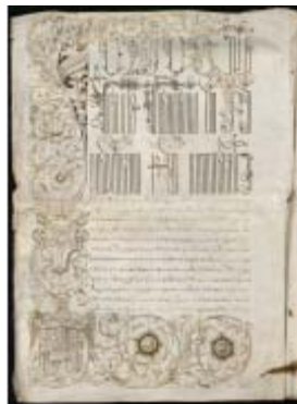
El papa Julio II otorga la investidura del reino de Nápoles a Fernando el Católico Roma, 1510, 3 de julio Madrid, Archivo Histórico Nacional

También se pueden contemplar los retratos del emperador Maximiliano I y de Felipe I, el Hermoso; éste último procedente de la Colección de Ambras de Viena, y la estatua funeraria del inquisidor Pedro Arbués. En el ámbito de las personalidades religiosas, lugar destacado merece también el retrato del Cardenal Cisneros en alabastro policromado obra de Felipe Vigarny y Fernando del Rincón, artistas al servicio del rey de Aragón. Junto a él se expone el retrato del Papa Alejandro VI