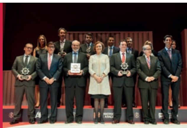
Ceremonia de entrega del Premio PILOT a la Excelencia Logística 2014