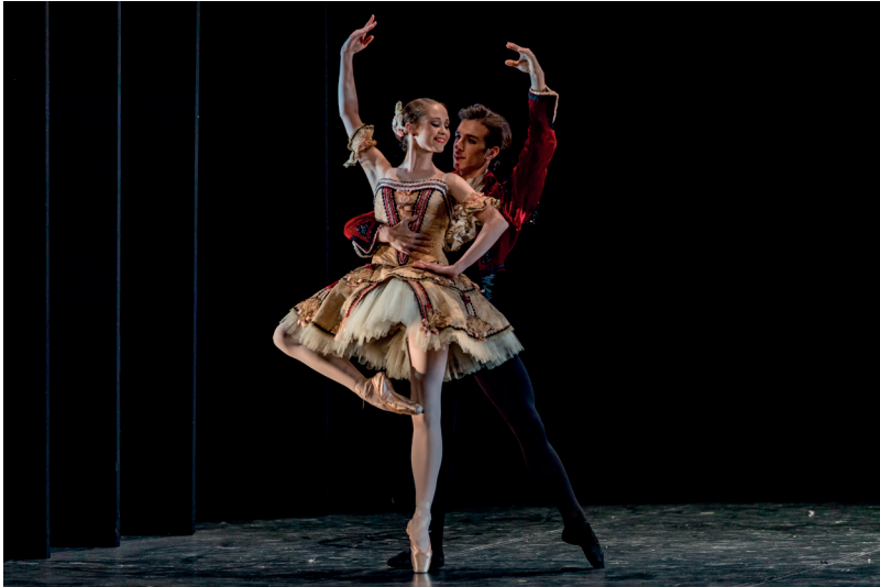
Ópera Nacional de París.